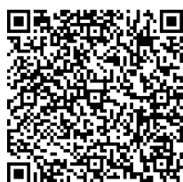
温度急変検知 動画