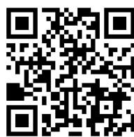
HEAT SHIFT® ホームページ